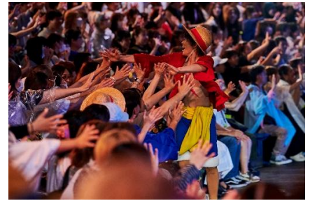
* 이미지는 과거 개최 당시의 모습입니다.