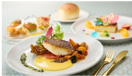
레이디에게 바치는 부아트아 비주 ~사랑의 보석함~ (생선)