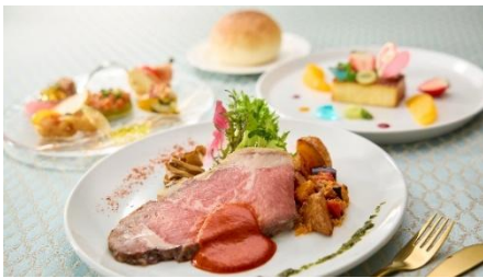
레이디에게 바치는 부아트아 비주 ~사랑의 보석함~ (고기)