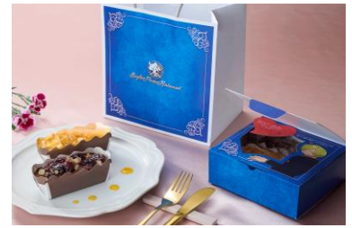
레이디에게 바치는 메로린 러브 디저트

* 테이크아웃 디저트 <레이디에게 바치는 메로린 러브 디저트>의 사전 구매는 <상디의 해적 레스토랑> 티켓 예매 시에만 신청할 수 있습니다. 당일 현장 판매는 진행되지 않으므로 주의해 주시기 바랍니다.